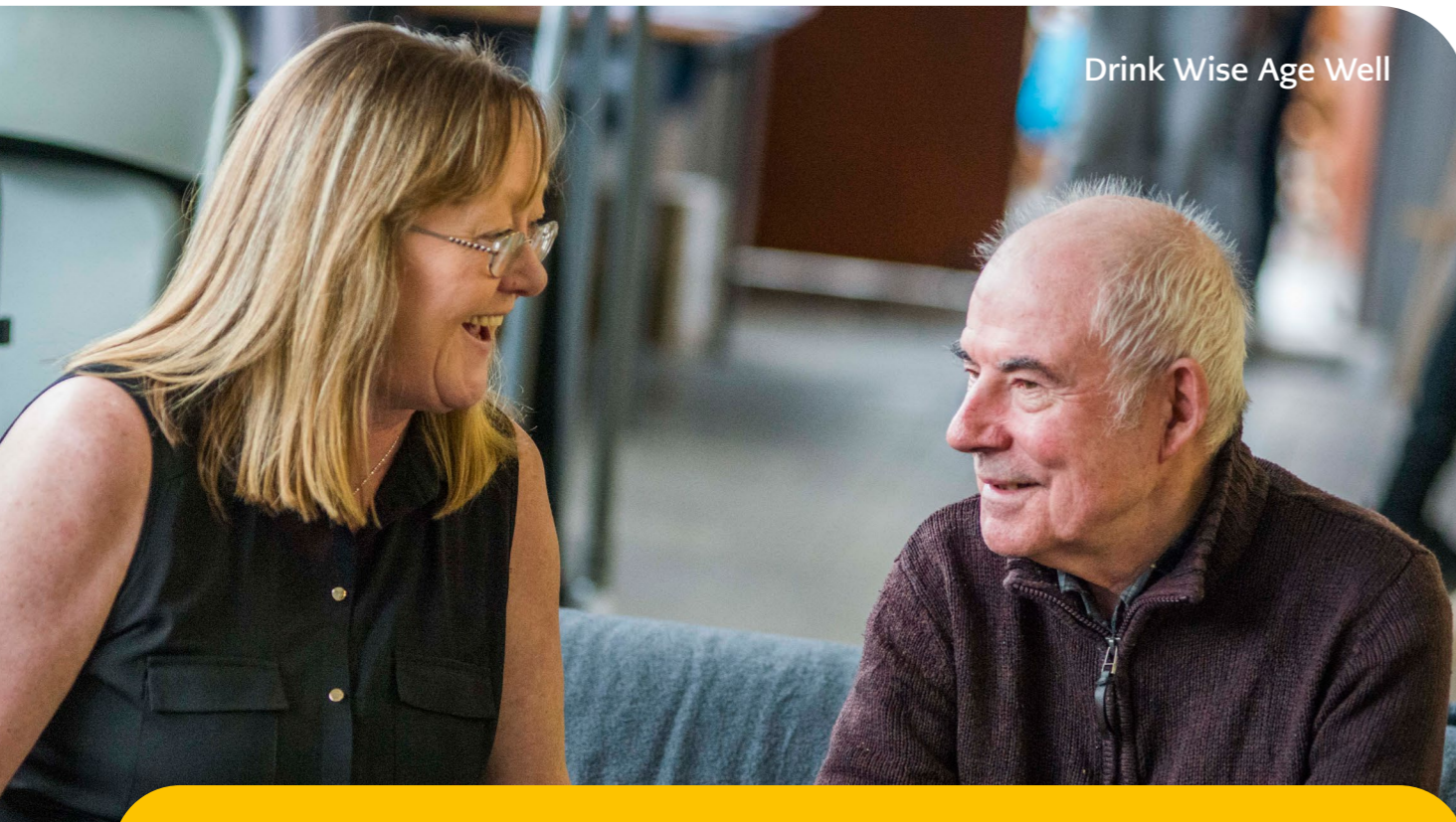
Drink Wise Age Well

Fe gychwynnom gydweithrediad ag arianwyr eraill - gan chwarae rhan weithredol wrth ddatblygu Hwb Cydweithredol i Arianwyr. Yn cael ei letya gan y Gymdeithas Sefydliadau Elusennol, mae'r Hwb yn cynnig gwell dealltwriaeth, aliniad agosach, a chyfleoedd i arianwyr gydweithredu mewn ymateb i COVID-19.