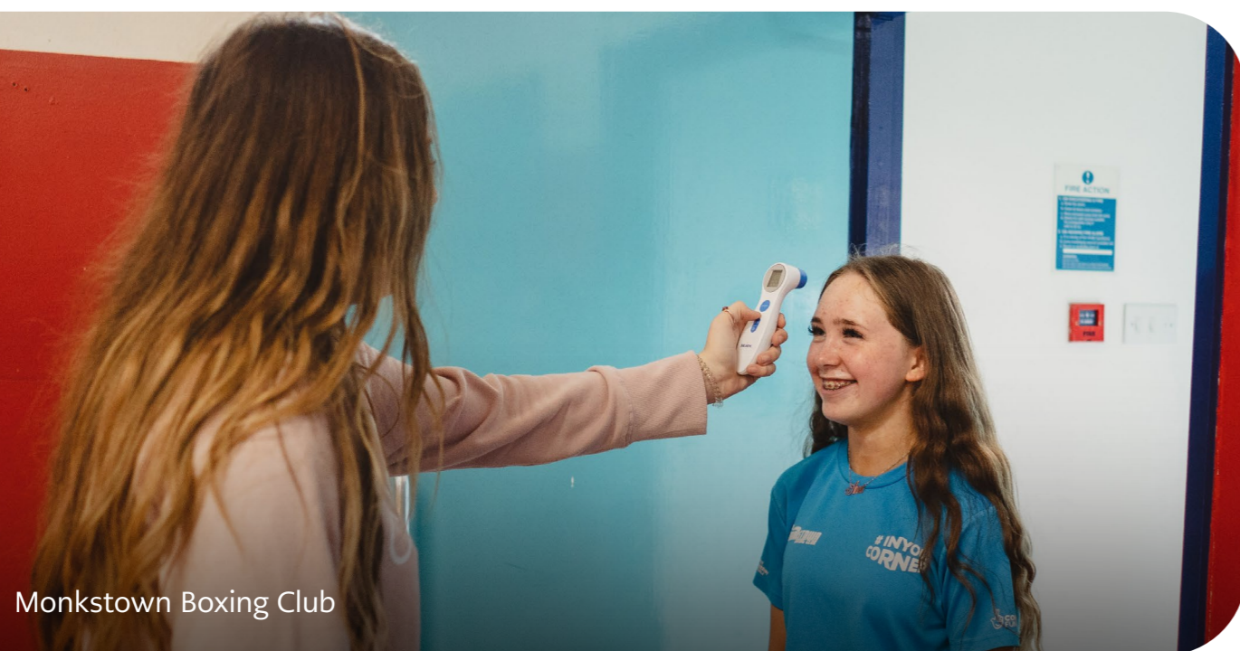
Monkstown Boxing Club

Rhan fawr o'n gwaith partneriaeth fu cyrraedd cymunedau a gafodd eu heffeithio fwyaf gan y pandemig - oherwydd hynny, bydd tegwch, amrywiaeth a chynhwysiant (EDI) a chroestoriadedd yn parhau i fod yn ffocws mawr i ni yn 2021. Rydym eisoes yn aelodau o'r glymblaid Amrywiaeth, Ecwiti a Chynhwysiant lle rydym yn gweithio gydag arianwyr eraill i sicrhau ein bod gyda'n gilydd yn dod yn fwy cynhwysol ac yn gweithio tuag at ganlyniadau teg. Rydym hefyd yn gweithio ochr yn ochr ag arianwyr eraill a 360Giving i ddatblygu ein gallu i gipio gwell data ar y grwpiau sydd heb gynrychiolaeth ddigonol yr ydym yn bwriadu eu cyrraedd trwy ein hariannu. Rydym yn glir bod ariannu'r Loteri Genedlaethol ar gyfer pawb ac wedi bod yn buddsoddi mewn rolau pwrpasol i'n cefnogi yn ein huchelgais i gyflawni ar gyfer pob cymuned ledled y DU.