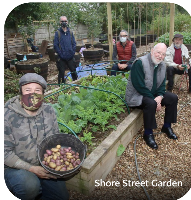
Shore Street Garden

Gweithiodd yr ymgyrch gyda sawl elusen proffil uchel megis FareShare, Y Groes Goch Brydeinig a Chymdeithas Alzheimer i dynnu sylw at gyfleoedd gwirfoddoli. Roedd dros 58% o'r rhai a ymwelodd â'r wefan ar gyfer yr ymgyrch yn edrych am ffyrdd i wirfoddoli yn eu cymuned leol. Roedd y ffyrdd o gymryd rhan yn amrywio o gymorth ar-lein a dros y ffôn, cyfeillio â'r rhai a allai fod yn unig, dosbarthu bwyd a defnyddio celf i helpu pobl â'u hiechyd meddwl a'u lles.