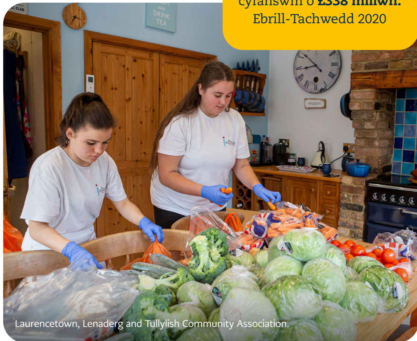
Laurencetown, Lenaderg and Tullylish Community Association.

Eleni gwnaethom *15,463 o ddyfarniadau gwerth cyfanswm o £338 miliwn. Ebrill-Tachwedd 2020