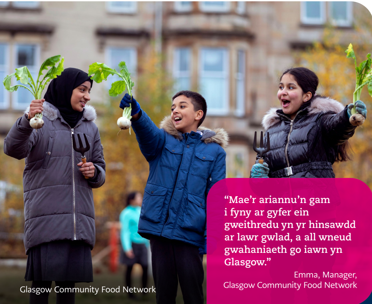
Glasgow Community Food Network

“Mae'r ariannu'n gam i fyny ar gyfer ein gweithredu yn yr hinsawdd ar lawr gwlad, a all wneud gwahaniaeth go iawn yn Glasgow.”