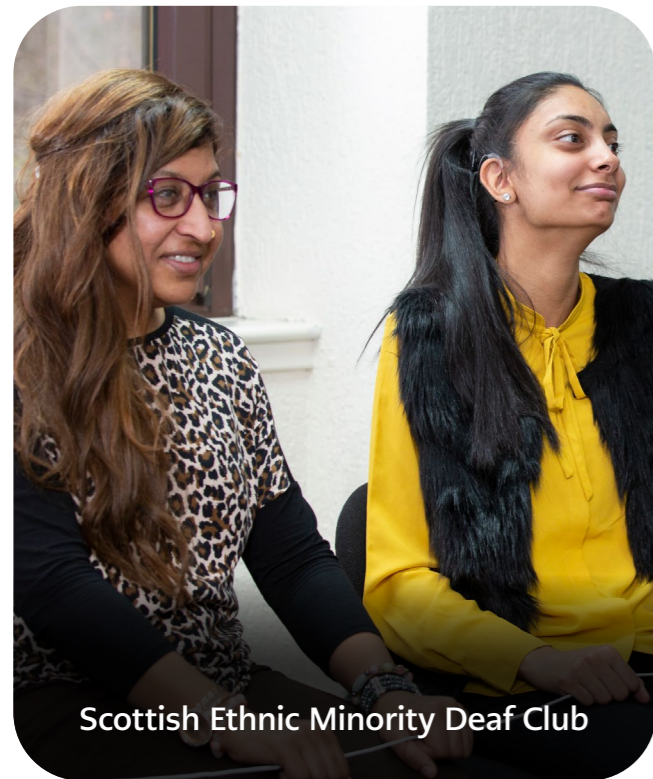
Scottish Ethnic Minority Deaf Club

Mae pobl wrth wraidd popeth a wnawn. Mae ein rhaglen Improving Lives yn cefnogi pobl i oresgyn amgylchiadau heriol a dod yn fwy gwydn. Mae ein £153,334 mewn ariannu i'r Scottish Ethnic Minority Deaf Club (SEMDC) wedi sicrhau bod eu hamrywiaeth hanfodol o weithgareddau a gwasanaethau cymorth i oedolion o'r gymuned ethnig fyddar, yn parhau i wneud gwahaniaeth dros y flwyddyn ddiwethaf anodd.