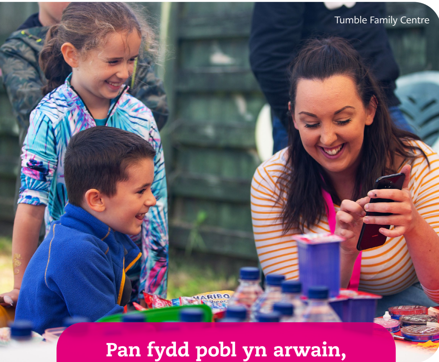
Tumble Family Centre

Pan fydd pobl yn arwain, mae cymunedau'n ffynnu.