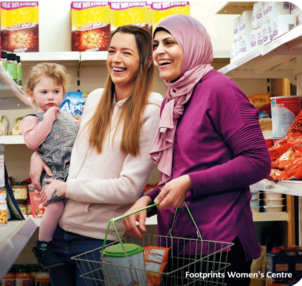
Footprints Women's Centre

Rydym ni'n cefnogi pobl a chymunedau i lwyddo a ffynnu