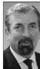
David Campbell CBE

Aelod Gogledd Iwerddon Cadeirydd, Pwyllgor Ffyrdd Actif o Fyw Gogledd Iwerddon