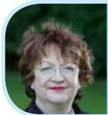
Breidge Gadd CBE

Aelod Cyffredinol Aelod, Pwyllgor Lloegr