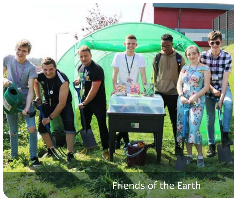
Friends of the Earth

Yng ngoleuni hyn, rydym yn ymchwilio i'r hyn rydym wedi'i ariannu yn y maes hwn cyn ac yn ystod y pandemig, a'r gwahaniaeth y mae hyn wedi'i wneud. Rydym yn defnyddio'r 4,200 o grantiau rydym wedi'u rhoi i elusennau a grwpiau cymunedol dros y pum mlynedd diwethaf i gefnogi gwirfoddoli, sy'n dod i gyfanswm o £690 miliwn o arian y Loteri Genedlaethol, y llywodraeth a thrydydd parti. 8 Rydym yn gwneud hyn i daflu goleuni ar gyfraniad y sector gwirfoddol a chymunedol (VCS) a'r gwirfoddolwyr y maent yn gweithio gyda nhw.