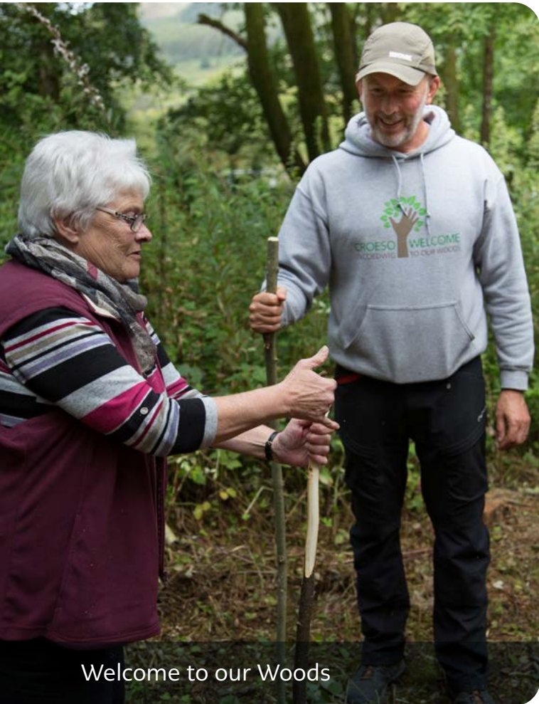
Welcome to our Woods

Mae'r adroddiad hwn yn canolbwyntio'n bennaf ar wirfoddoli a gwirfoddoli ffurfiol fel gweithredu cymdeithasol, a llai ar wirfoddoli anffurfiol a wneir y tu allan i sefydliad – er y bydd hyn yn cael ei gynnwys lle mae ein deiliaid grant yn ei gydnabod fel gwirfoddoli. Er y gallwn dynnu oddi ar raglenni sydd weithiau'n talu neu'n digolledu pobl sydd â phrofiad o lygad y ffynnon am eu hamser, rydym yn canolbwyntio ar enghreifftiau o gymorth gwirfoddol.