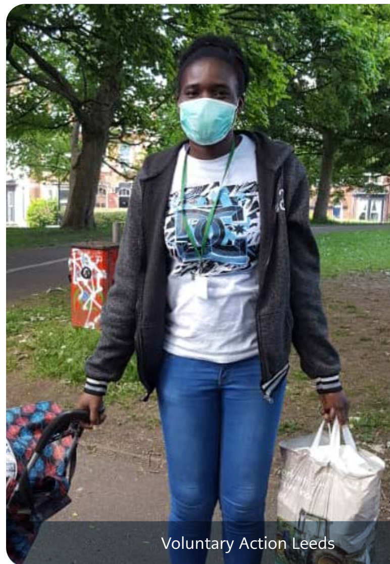
Voluntary Action Leeds

Felly edrychodd VAL ar draws y sector, gan fwydo gwirfoddolwyr allan i'r 1,500 o sefydliadau Leeds a oedd yn ymateb i Covid, a chefnogi grwpiau i wneud y gorau o'r rhai a oedd am helpu. Gan nad oedd gan lawer y gallu a'r profiad i reoli cronfeydd mwy o wirfoddolwyr, helpodd VAL gyda gwiriadau cefndir, megis gwirio trwyddedau gyrru, a mynd â phobl drwy'r broses fetio. Torrodd restrau o wirfoddolwyr, fesul ward, a'u cysylltu â sefydliadau lleol. Roeddent hefyd yn darparu "arweiniad, cymorth a phecyn – deunyddiau cynefino, rhestrau gwirio, popeth yr oedd ei angen arnynt i weithio gyda'r gwirfoddolwyr." Roedd cymorth yn arbennig o bwysig i sefydliadau llai, yr oedd angen help arnynt i feithrin eu seilwaith mewnol a'u hyder. 25