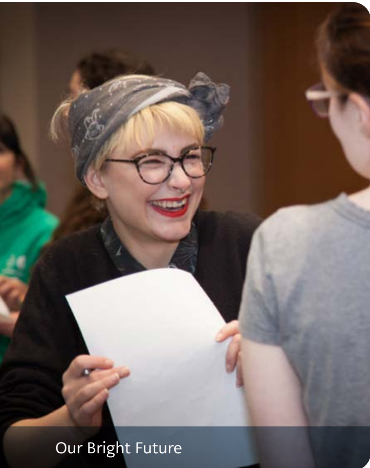
Our Bright Future

Gwyddom fod gwirfoddolwyr yn elwa o helpu eu cymunedau. Mae ein harolwg o bron i 14,000 o bobl a wirfoddolodd gyda phrosiectau a ariannwyd gan CCSF yn nodi bod mwyafrif llethol y cyfranogwyr (99%) wedi profi o leiaf un budd personol o wirfoddoli, gyda "gwneud gwahaniaeth" (84%) ac "ymdeimlad o bwrpas" neu "gyflawniad personol" (y ddau yn 66%) arbennig o gyffredin.