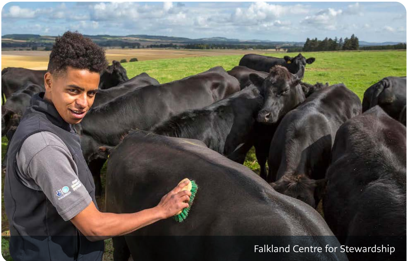
Falkland Centre for Stewardship

Mae rhaglenni eraill yn canolbwyntio ar wirfoddoli fel cyfrwng ar gyfer newid, gan gynnwys 10 partneriaeth Gweithredu Cymdeithasol seiliedig ar Leoedd ledled Lloegr sy'n dod â chymunedau lleol ynghyd â grwpiau ar lawr gwlad, sefydliadau'r sector cyhoeddus, darparwyr gwasanaethau a busnesau i fynd i'r afael â blaenoriaethau yn eu cymdogaethau. Hyd yma mae 1,320 o wirfoddolwyr yn gweithio tuag at welliannau lleol; o wella trafndiaeth leol, i greu gweledigaethau newydd ar gyfer eu hardal, fel bwrdeistref sy'n ystyriol o ddementia yn Colchester. 15